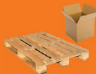
Bois et cartons volumineux