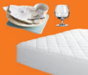
Encombrants et gravats