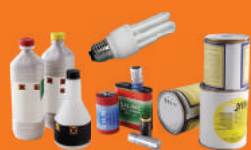
Déchets chimiques et toxiques

Tout dépôt hors des conteneurs prévus à cet effet fera l'objet de poursuites : jusqu'à 1 500 € D'AMENDE ET CONFISCATION DU VÉHICULE conformément à l'article L541-3 du Code de l'Environnement