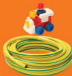
Objets en plastique et électriques

À DÉPOSER EN DÉCHÈTERIE (LISTE NON EXHAUSTIVE), ADRESSEZ-VOUS AU GARDIEN PRÉSENT SUR PLACE