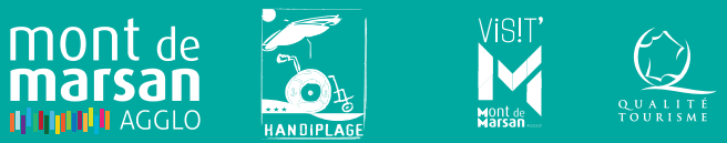
Graphisme : Mont de Marsan Agglo - Service Communication / Impression Lacoste-Roque Mont de Marsan / ©Photos : Cilles Arroyo, Nicolas LeLievre, Office de tourisme du Marsan.

40280 St Pierre du Mont basedeloisirsdumarsan.fr BaseDeLoisirsduMarsan