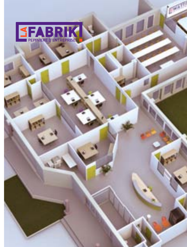
Open source | Éco-technologies | Design industriel | Industrie de l'image

Un environnement protégé, des villes et villages dynamiques, une vie culturelle et sportive riche, un patrimoine naturel généreux... Un territoire où il fait bon vivre.